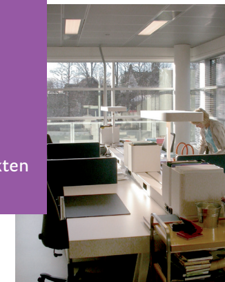
Lehrerarbeitsraum an der Ringstabekk Skole, Baerum, Norwegen